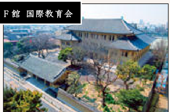
F 館 国際教育会